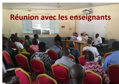
Réunion avec les enseignants