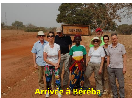
Arrivée à Béréba

Arrivée à Béréba où nous avons le plaisir de faire la connaissance du nouvel Inspecteur des écoles avec lequel nous entretiendrons aussi une communication suivie.