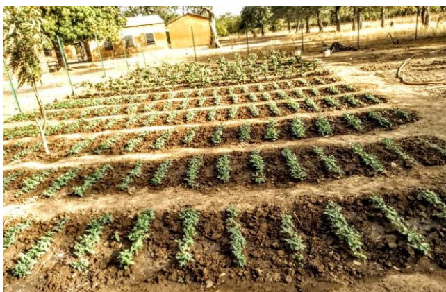
Notre premier jardin d'école à Béréba (2012)