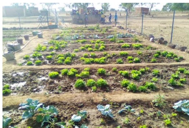
Jardin de Bankoni Lions de Joué les Tours