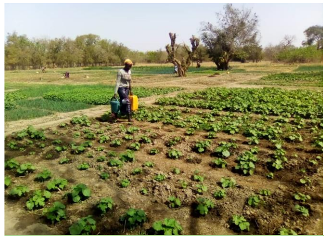
Jardin Maraicher des Femmes de Maro