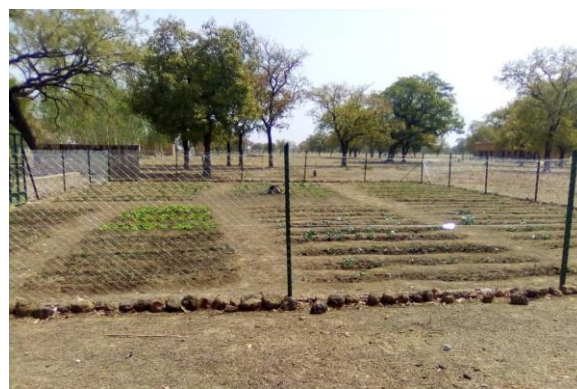
Nouveau Jardin de Dabéré