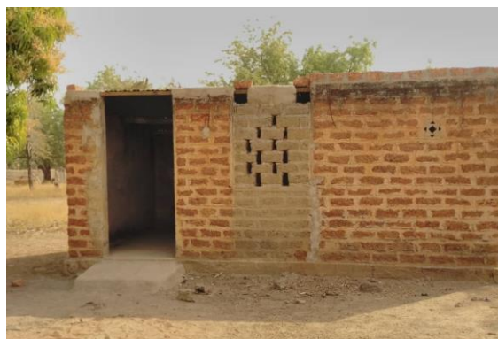
Réfection de la cantine de l'école de Béréba