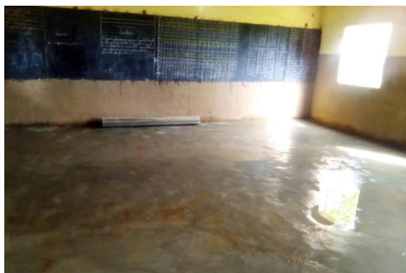
Nouvelle chape de l'école de Ouani