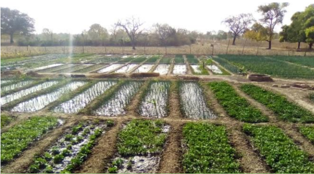
Jardin Maraicher de Béréba

C'est pour notre association une grande satisfaction.