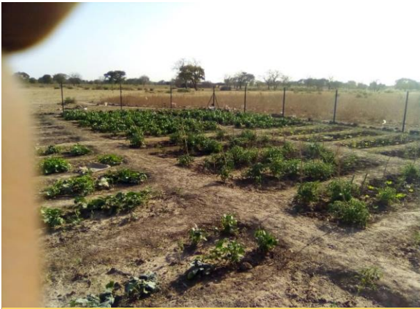
Jardin de notre partenaire AVE