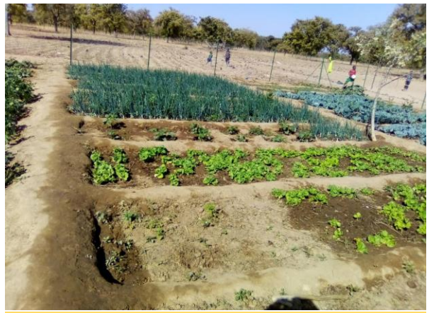
Jardin de notre partenaire SITEK