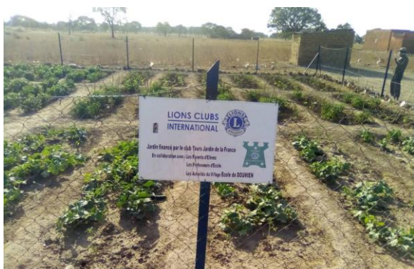
Jardin de Doumien Lions Tours Jardin de la Fr